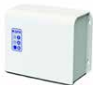
Bloco eletrónico deportado